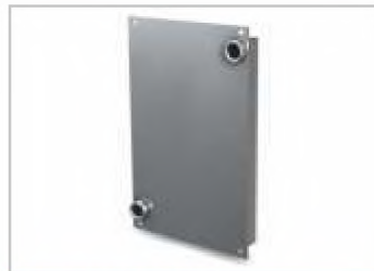
теплообменник для банной печи