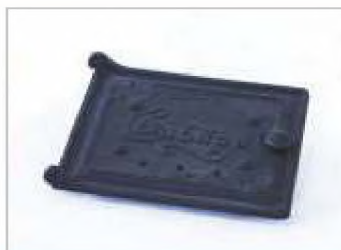
Дверка топочная чугунная