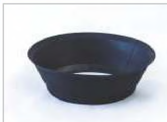
Конус «непросыпайка» для котлов «Сибирь»