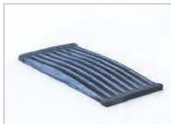
Колосники для котлов и печей